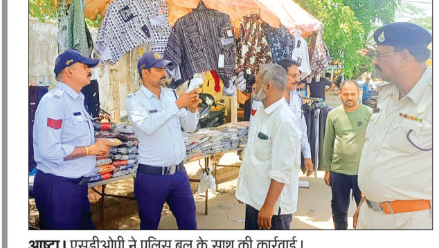
आष्टा। एसडीओपी ने पुलिस बल के साथ की कार्रवाई।