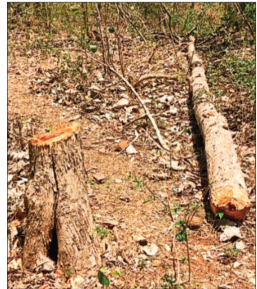
इछावर। वन माफियाओं ने बड़ी तादाद में पेड़ों की अंधाधुंध कटाई कर टूट में तब्दील कर दिया

फीट के बाद कुछ नहीं दिखता था, लेकिन अब पेड़ों की अंधाधुंध कटाई के कारण दूर-दूर तक स्पष्ट दिखाई दे रहा है। जंगल पठार और खेत का आकार ले चुके हैं।