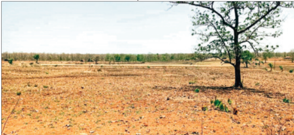
इछावर। नादान वीट के मंगलगढ़ के जंगल में वन माफियाओं ने अवैध कटाई कर जंगल को खेत में तब्दील कर दिया।

वनपरिक्षेत्र के अंतर्गत आने वाले नादान, बालुपाट, मंडलगढ़, इमलीपठार, अलीपुर, इंडलाव, गादिया, मगरपाट आदि क्षेत्रों में विभाग की उदासीनता के कारण वनमाफियाओं और अतिक्रमणकारियों द्वारा जंगल का तेजी से सफाया किया जा रहा है। आरोपियों द्वारा हरे-भरे पेड़-पौधे खासकर सागौन के पेड़ों की अंधाधुंध कटाई करने में जुटे हैं। यह हरियाली पर दिन-रात कुल्हाड़ियों चलाकर जंगल को भारी नुकसान पहुंचा रहे हैं। लकड़ी चोर बड़ी संख्या में दिन दहाड़े जंगल में घुसकर पेड़ों को काटते हैं, और फिर उनकी चरपट बनाकर मोटरसाइकिल, चार पहिया वाहन में भरकर दूर-दूर शहरों में सप्लाई कर रहे हैं। वन माफिया और अतिक्रमणकारियों द्वारा योजना बड़ी संख्या में